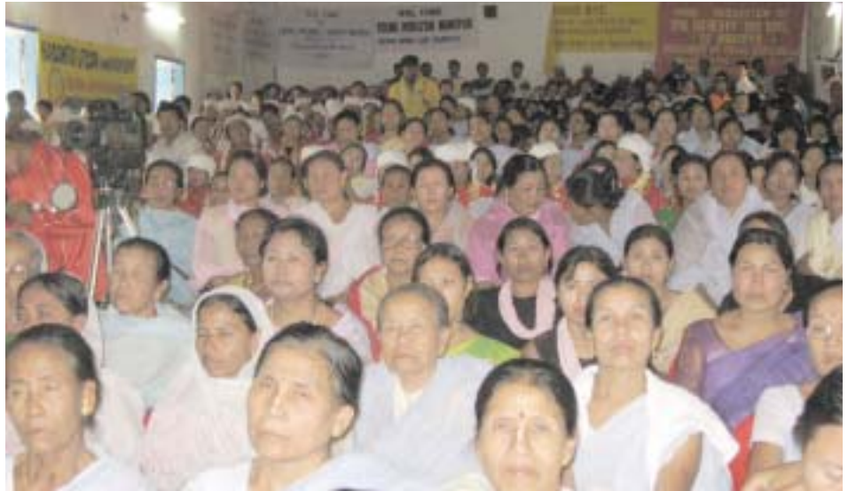
ਹਕੂਮਤੀ ਦਹਿਸ਼ਤਗਰਦੀ ਵਿਰੁੱਧ, ਇੰਫਾਲ ਵਿੱਚ ਔਰਤਾਂ ਦੀ ਸਭਾ

ਇਹ ਹੁਣ ਇੱਕ ਪੂਰੀ ਤਰ੍ਹਾਂ ਸਾਬਤ ਹੋ ਚੁੱਕੀ ਸੱਚਾਈ ਹੈ ਕਿ ਰਾਜ ਦੀਆਂ ਸੁਰੱਖਿਆ ਏਜੰਸੀਆਂ, ਵੱਖ-ਵੱਖ ਰੂਪੋਸ਼ ਦਹਿਸ਼ਤਗਰਦ ਗ੍ਰੋਹਾਂ ਨੂੰ ਸੰਗਠਤ ਕਰਦੀਆਂ ਹਨ ਅਤੇ ਉਨ੍ਹਾਂ ਨਾਲ ਗੂੜ੍ਹੇ ਸਬੰਧ ਰੱਖਦੀਆਂ ਹਨ। ਇਹ ਗ੍ਰੋਹ ਵੱਡੇ-ਵੱਡੇ ਕਤਲੇਆਮ, ਬੰਬ ਕਾਂਡ, ਆਦਿ ਕਰਦੇ ਹਨ ਜਿਨ੍ਹਾਂ ਲਈ ਆਮ ਲੋਕਾਂ ਨੂੰ ਤੰਗ ਕੀਤਾ ਜਾਂਦਾ ਹੈ। ਏਸ ਤਰ੍ਹਾਂ ਪੈਦਾ ਹੋਏ ਦਹਿਸ਼ਤ ਅਤੇ ਅਸੁਰੱਖਿਆ ਦੇ ਮਹੌਲ ਅੰਦਰ, ਅਕਸਰ ਰਾਜ ਦੀਆਂ ਏਜੰਸੀਆਂ ਲਈ ਮੁਕਾਬਲਿਆਂ ‘ਚ ਕੀਤੇ ਕਤਲਾਂ ਨੂੰ ਜਾਇਜ਼ ਠਹਿਰਾਉਣਾ, ਅਤੇ ਨਾਲੋ-ਨਾਲ ਵੱਡੇ ਪੈਮਾਨੇ ਤੇ ਫਿਰਕੂ ਅਤੇ ਉਗਰ-ਰਾਸ਼ਟਰਵਾਦੀ ਪ੍ਰਚਾਰ ਕਰਨਾ ਅਸਾਨ ਹੋ ਜਾਂਦਾ ਹੈ।