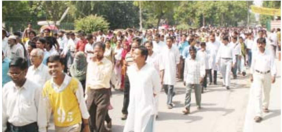
ਦਿੱਲੀ 'ਚ ਫਰਜ਼ੀ ਮੁਕਾਬਲੇ ਵਿਰੁੱਧ, ਜਾਮੀਆਂ ਮਿਲੀਆ ਯੂਨੀਵਰਸਿਟੀ ਦੇ ਵਿਦਿਆਰਥੀਆਂ ਅਤੇ ਅਧਿਆਪਕਾਂ ਦਾ ਮਾਰਚ

1960 ਅਤੇ 70 ਦੇ ਦਹਾਕਿਆਂ ਵਿੱਚ, ਪੱਛਮੀ ਬੰਗਾਲ ਅਤੇ ਦੇਸ਼ ਦੇ ਹੋਰ ਹਿੱਸਿਆਂ ਵਿੱਚ, ਨਕਸਲਵਾਦੀਆਂ ਨਾਲ ਨਿਪਟਣ ਦੇ ਨਾਂ ਹੇਠ ਸੈਂਕੜੇ ਹੀ ਨੌਜਵਾਨਾਂ ਦੇ ਕਤਲਾਂ ਨੂੰ ਉਚਿਤ ਠਹਿਰਾਉਣ ਲਈ, ਨਿਯਮਤ ਤੌਰ ਤੇ “ਮੁਕਾਬਲੇ” ਕੀਤੇ ਜਾਂਦੇ ਸਨ।